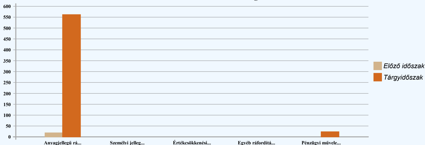
Ráfordítások alakulása és megoszlása